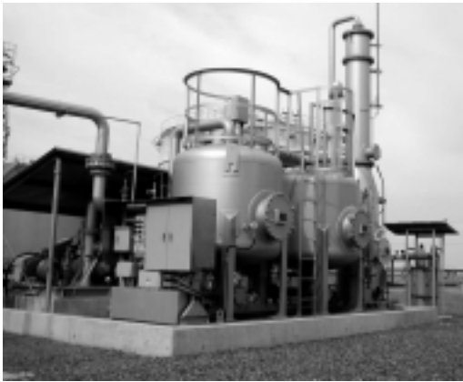
写真1 HC VRU全景